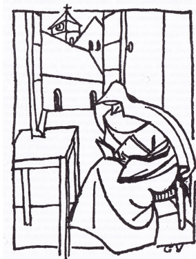
Lectio divina Dessin de Mère Geneviève Gallois.